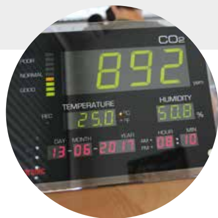
Raumluft Messgerät (Beispiel)